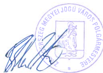
Balaicz Zoltán polgármester