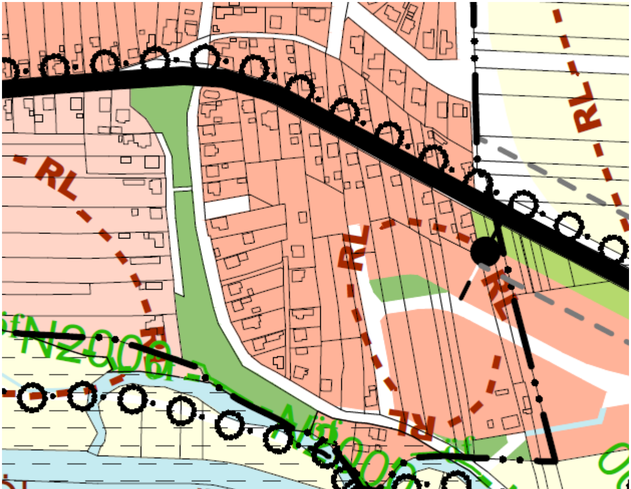
tervezett településszerkezeti terv részlet

Az előterjesztés 1. melléklete (záró dokumentáció) helyébe jelen kiegészítés 1. melléklete lép, mely terjedelme miatt digitális formában kerül megküldésre és a közgyűlésen tekinthető meg.