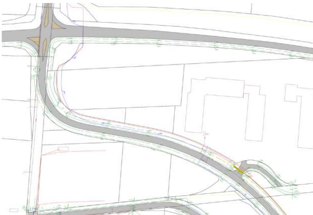
az érintett terület közműveket ábrázoló alaptérképi részlete