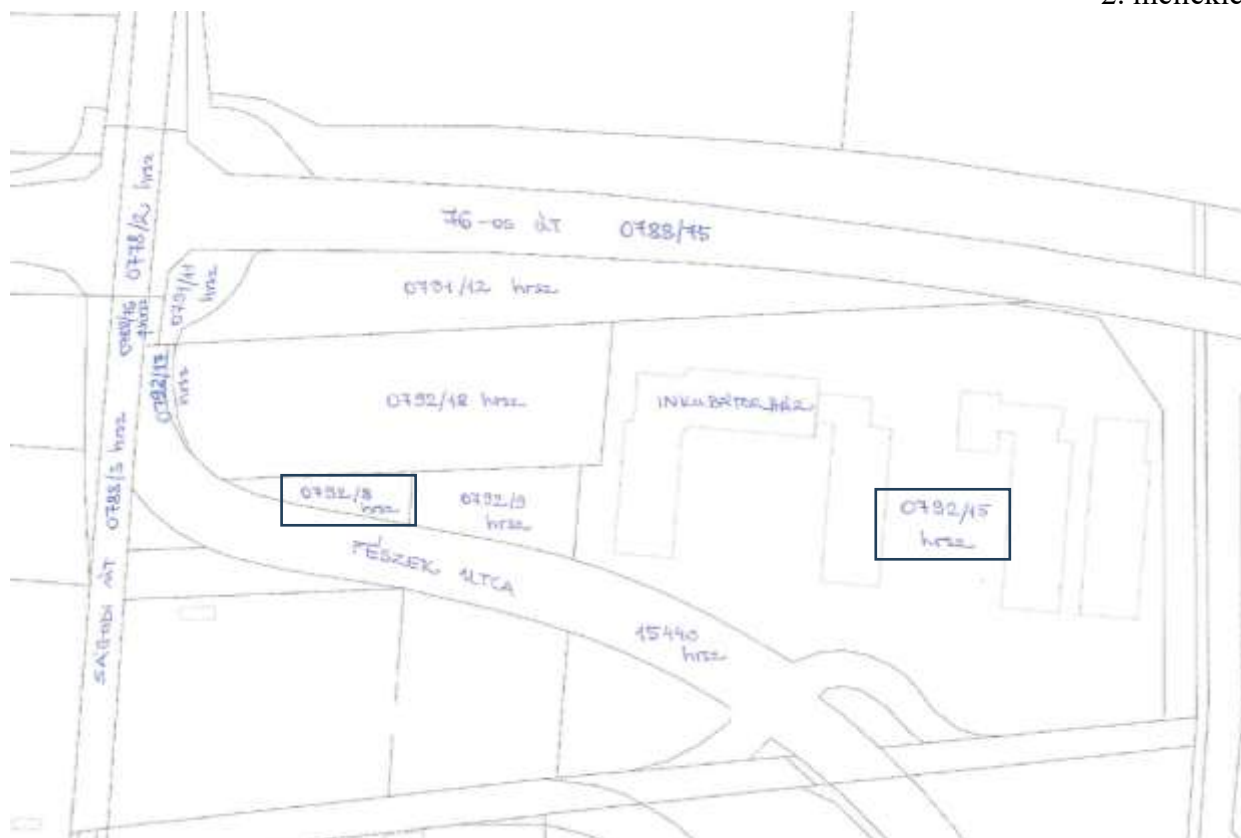
az érintett terület alaptérképi részlete