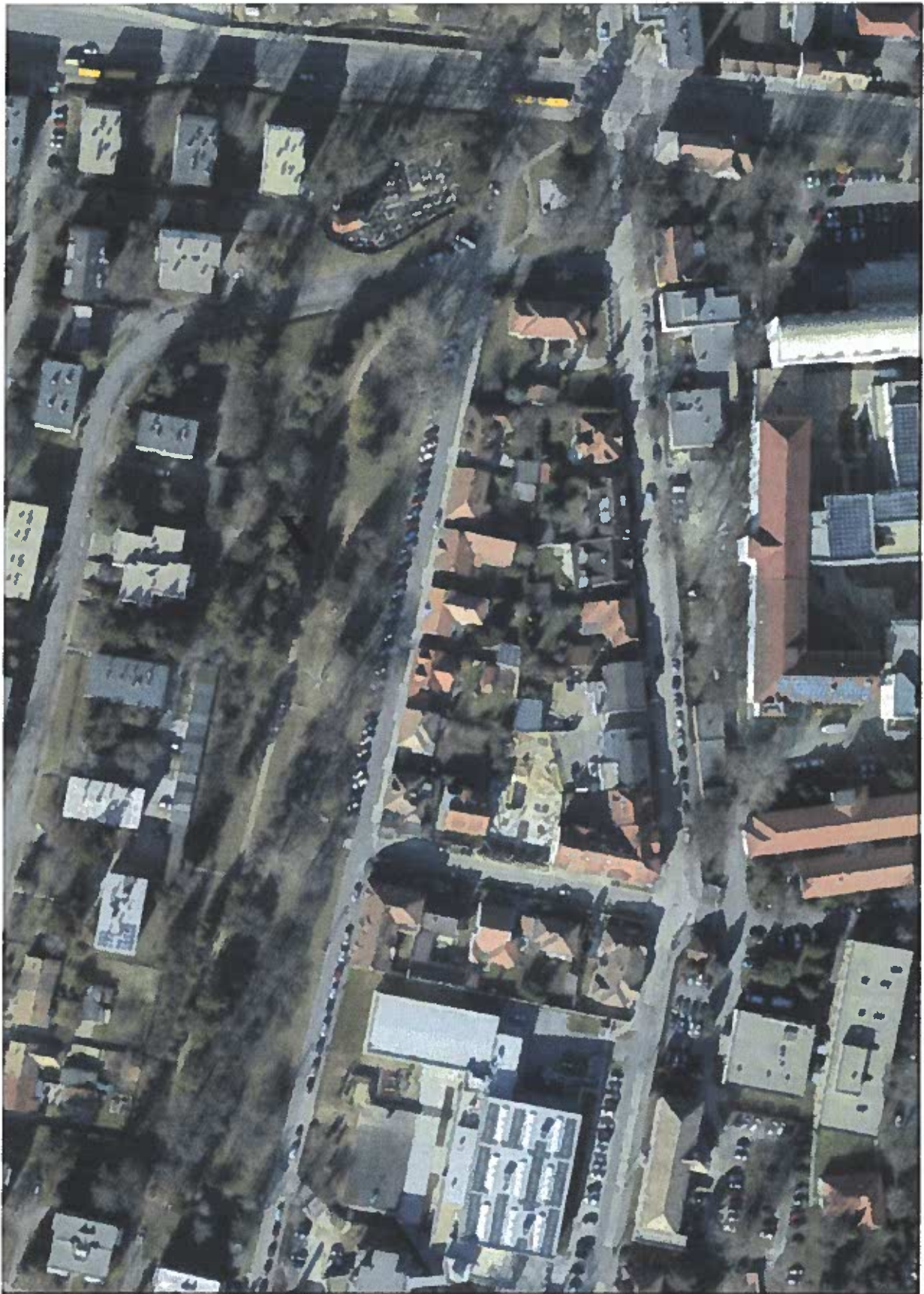
Az „X” jelöli a szobor helyszínét, amely a tervek szerint a ligetben található sétányon fog elhelyezkedni.