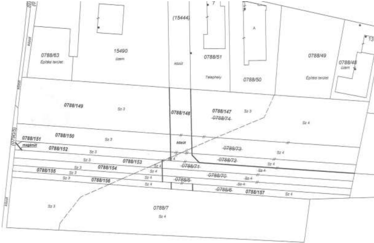
változási vázrajz részlet a telekosztásról

A döntés óta a határozatban szereplő Zalaegerszeg 0788/5, 0788/6, 0788/70, 0788/71, 0788/72, 0788/73, 0788/74 hrsz-ú területek megosztásra kerültek. A megosztás során létrejövő hrsz-ok: 0788/147, 0788/148, 0788/149, 0788/150, 0788/151, 0788/152, 0788/153, 0788/154, 0788/155, 0788/156, 0788/157. A 0788/147 hrsz-ú ingatlan további megosztása került, a 0788/158 és 0788/159 hrsz-ú ingatlanok keletkeztek belőle.